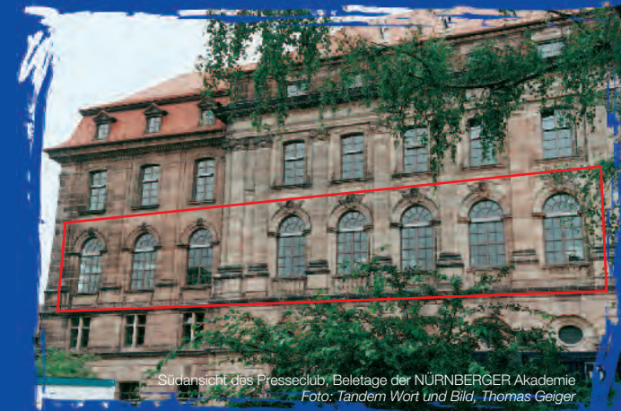
Südansicht des Presseclub, Beletage der NÜRNBERGER Akademie

Gestaltung: PicaArt Werbeagentur Nürnberg · Druck: Druckerei Schembs, Nürnberg 7. Auflage Juli 2014