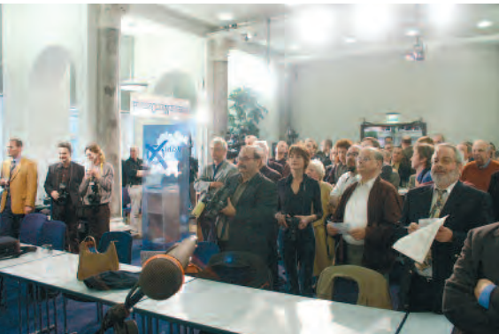
Warten auf die Ergebnisse: Das Wahlamt im Presseclub mit Live-Übertragung