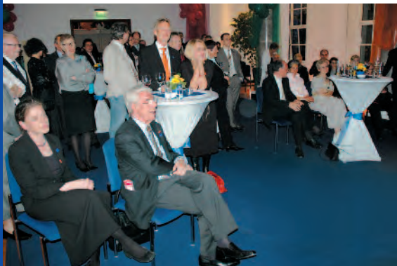
Jubiläumsfeier „10 Jahre Presseclub Nürnberg im Marmorsaal der NÜRNBERGER Akademie“

Im Presseclub bietet die Cafeteria auf der Galerie des Foyers Getränke nach Wahl. Für alle Anforderungen der Bewirtung des Marmorsaaes, des Foyers und der Galerie können kompetente Catering-Partner vermittelt werden.