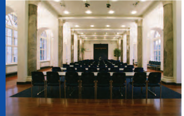
Vorträge, Festakte, Konzerte in glanzvollem Rahmen

Der Marmorsaal bietet eine Fläche von ca. 240 Quadratmetern. Die Möblierung mit bis zu 200 Stühlen und 30 Tischen gibt dem Veranstalter vielerlei Möglichkeiten, sowohl Frontalbestuhlung zum Rednerpult (200 Personen) oder parlamentarische Tisch- und Stuhlanordnung (ca. 80 Personen), Round-Table-Konferenz (max. 50 Personen) als auch konventionelle Sitzgruppen mit Tischen (ca. 80 Personen).