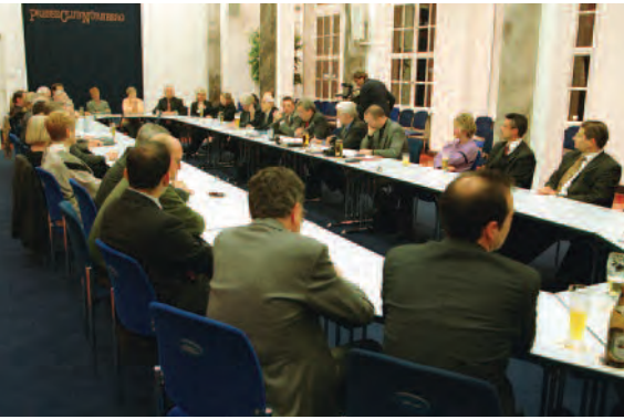
Diskussionsabend im Presseclub

Der Presseclub Nürnberg e. V., gegründet 1990, ist das zentrale Informations- und Diskussionsforum für Journalisten und Vertreter von Politik, Wirtschaft und Kultur in der Metropolregion Nürnberg. Sein Domizil ist seit 1997 der Marmorsaal mit Foyer und Galerie-Cafeteria in der NÜRNBERGER Akademie, Gewerbemuseumsplatz 2, 90403 Nürnberg.