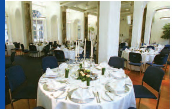
Einladung zum festlichen Anlass: Geburtstage, Hochzeiten, Jubiläen (runde Tische über den Caterer).

Der Marmorsaal bietet eine Fläche von ca. 240 Quadratmetern. Die Möblierung mit bis zu 200 Stühlen und 30 Tischen gibt dem Veranstalter vielerlei Möglichkeiten, sowohl Frontalbestuhlung zum Rednerpult (200 Personen) oder parlamentarische Tisch- und Stuhlanordnung (ca. 80 Personen), Round-Table-Konferenz (max. 50 Personen) als auch konventionelle Sitzgruppen mit Tischen (ca. 80 Personen).