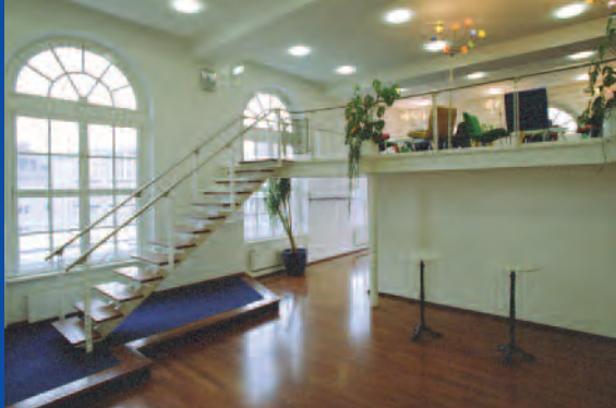
Foyer mit Aufgang zur Cafeteria

Im Presseclub bietet die Cafeteria auf der Galerie des Foyers Getränke nach Wahl. Für alle Anforderungen der Bewirtung des Marmorsaaes, des Foyers und der Galerie können kompetente Catering-Partner vermittelt werden.